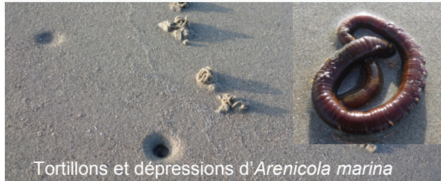
Tortillons et dépressions d' Arenicola marina