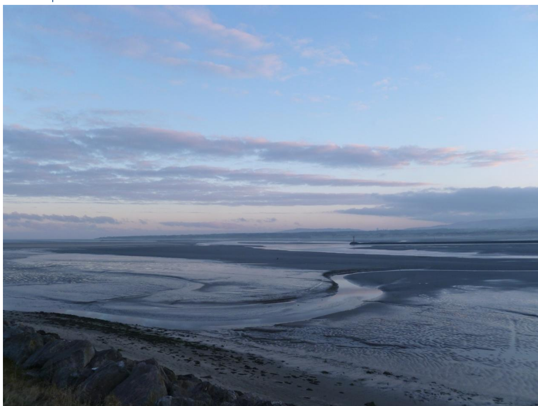
Baie de Canche à marée basse