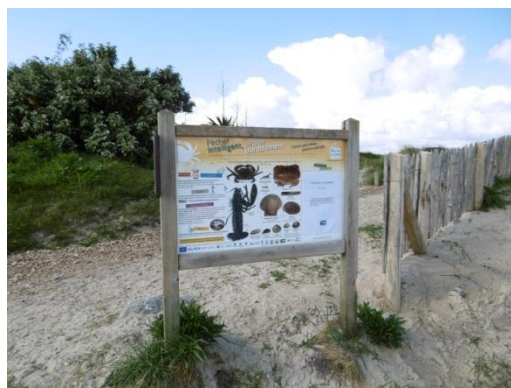
Panneau installé au camping de l'île-Grande, Pleumeur-Bodou.

Dix panneaux ont été inaugurés récemment à Pleumeur-Bodou et Trébeurden. Lannion-Trégor Communauté travaille actuellement à l'inventaire des anciens panneaux qu'il serait bon de remplacer en accord avec les communes et les associations locales des plaisanciers sur la zone Natura 2000 Côte de Granit Rose – Sept îles. Un travail similaire peut être envisagé avec les autres opérateurs Natura 2000.