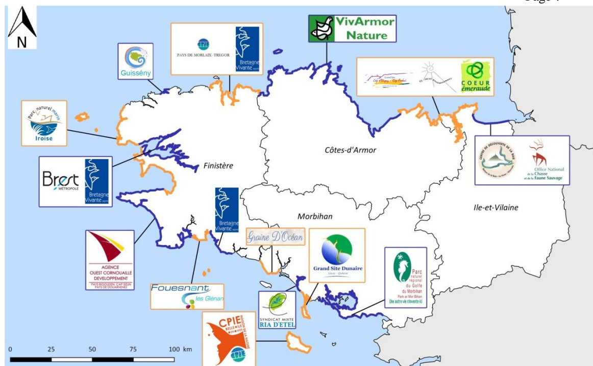
Carte extraite d'une note de structuration d'un réseau breton de partenaires et territoires pour une pêche à pied durable

La carte ci-dessus présente uniquement les structures susceptibles de maintenir ou mettre en place des actions sur leur territoire respectif. La carte ne représente pas les nombreux partenaires participants aux instances de concertation et actions de terrain.