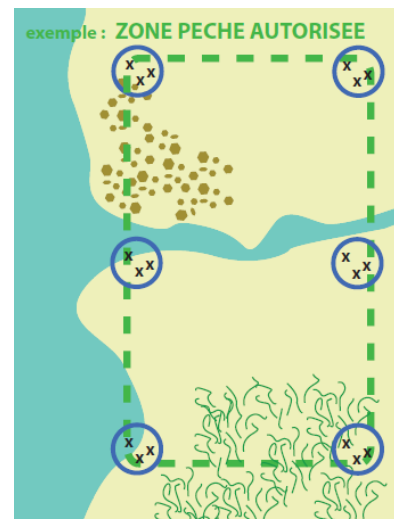
Fig.1 : stratégie d'échantillonnage : une zone de 100m X 50m est décrite par 6 stations positionnées selon un maillage de 50m. Trois répliquats sont réalisés au hasard dans chaque station.