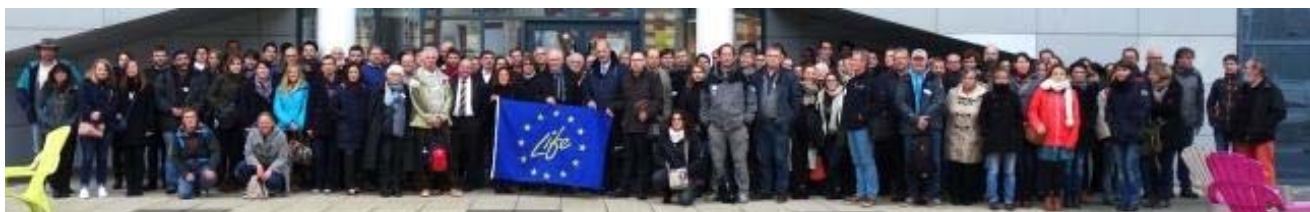
Plus de 210 participants au colloque final du projet Life Pêche à pied de loisir (24/12/2016)

Pour le territoire des estuaires picards et de la mer d'Opale, 17 panneaux ont été installés sur environ 90 km de côte, du cap Gris Nez (commune d'Audinghen) au Gois de Cise (commune d'Ault). Dans le Golfe normand breton, 66 panneaux sont prévus (35 financés par l'Agence des aires marines protégées et 31 par les communes) d'Erquy à Surtainville (sur les 3 départements des Côtes d'Armor, d'Ille-et-Vilaine, et de la Manche).